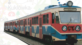
Linia Tradycji EKD/WKD w Grodzisku Mazowieckim