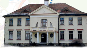
Muzeum im. Anny Jaroława Iwaskiewiczów w Stawisku