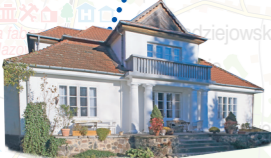
Dworek Adama Chełmńskiego w Adamowiznie