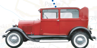
Muzeum Motoryzacji i Techniki w Otrębusach